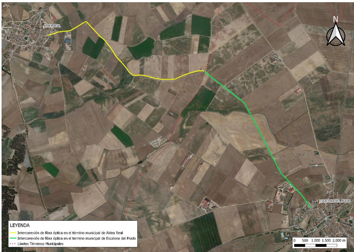
Figura 1. Trazado de la instalación.