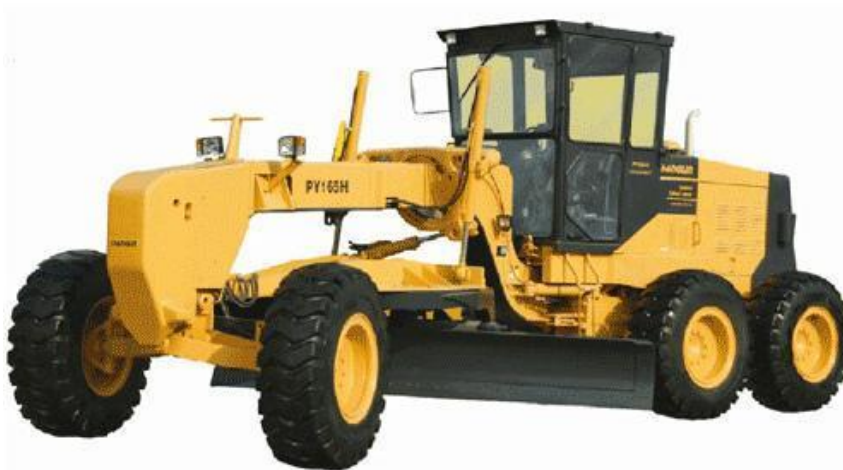
Figura 4. Niveladora