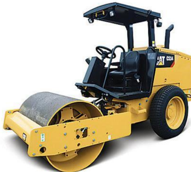
Figura 5. Rulo compactador.