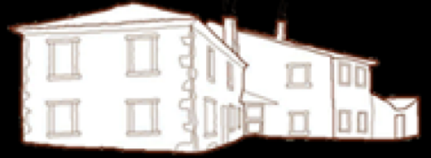
Molino de la Ferrería